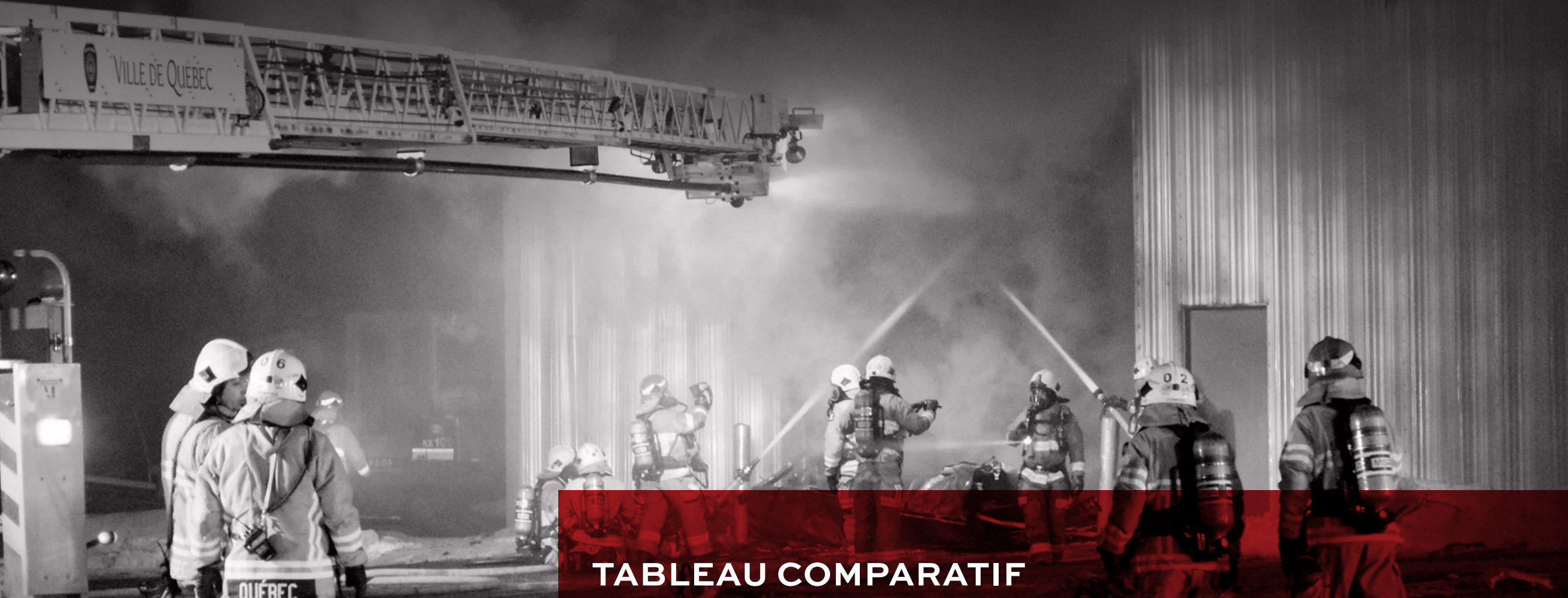
TABLEAU COMPARATIF des maladies professionnelles présumées chez les pompiers